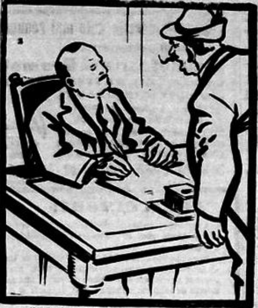
— No, che, ne am împacat... — Bine, frate, că am terminat-o. Acum ce mai vrei? — Scoală-te tu, să mă așez eu!